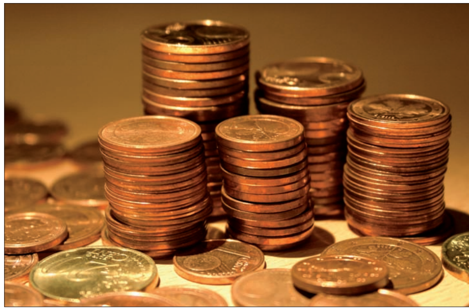
Grenzenlos zahlen: Die Idee hinter dem Euro wird mit SEPA auch für Überweisungen umgesetzt