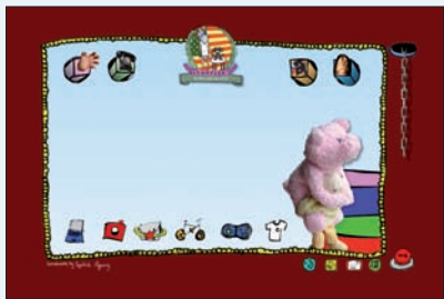
Alles im Sack: Crumpler Bags

Cebit-Retter 1: Wie kriegt man ein Notebook, eine Kamera mit Objektiv und Blitz, einen Klappschild, ein Dutzend Pressemappen und zwei Hände voll Kleinkram (Handy, Diktiergerät, Autoschlüssel) kreuz und quer über das Cebit-Gelände getragen, ohne dass es einem die Schulter bricht oder albern aussieht? Mit einer Umhängetasche der australischen Kultmarke Crumpler. Vermutlich ginge es auch mit einem Konkurrenzprodukt von Vaude, allerdings ist die Website von Crumpler allein schon ein Grund, sich so ein Teil zu holen. Was die Jungs geraucht haben, die diese Site programmiert haben – wir wissen es nicht. fk www.crumplerbags.com