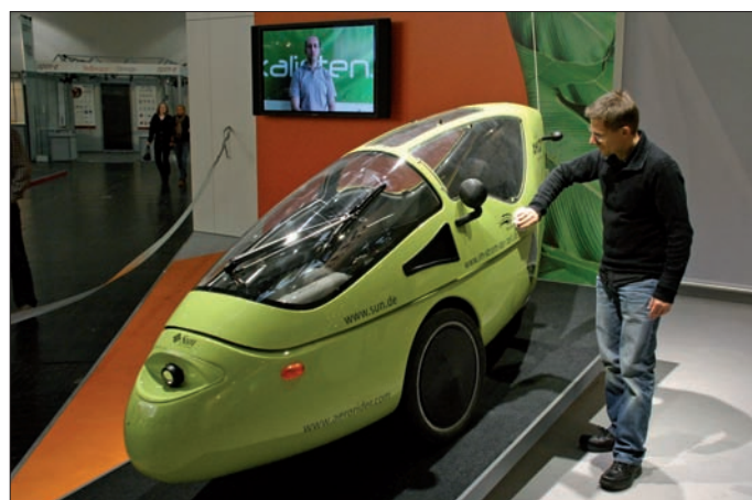
Hauptsache grün: Mit einem Öko-Auto machte Sun auf das Thema „Green IT“ aufmerksam – die Software AG zeigt einen Lamborghini

Die Rolle der Cebit als Branchentreff ist unbestritten, aber vermag sie auch noch Schwerpunkte in der globalen IT-Szene zu setzen? Das diesjährige Schwerpunktthema „Green IT“ – auch wenn Energiesparen weltweit ein wichtiges Anliegen ist – wirkte doch ein wenig bemüht. Zwar sprach Microsoft-Boss Steve Ballmer in einer völlig überfüllten Pressekonferenz von kaum etwas anderem, doch gibt es inzwischen ohnehin keinen Rechenzentrumsbetreiber mehr, der nicht mit spitzem Stift durchrechnet, wie er von seiner hohen Stromrechnung herunterkommt. fk