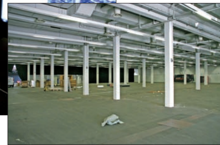
Viel Platz hier: Nicht alle Hallen konnten gefüllt werden

begrüßen wollte. Man musste in diesem Jahr – zumindest an den ersten Tagen – auch kein Rugby-Star sein, um schnell durch die Menschenmassen zu kommen. Das zu betrauern, setzt schon einen gewissen Hang zum Masochismus voraus.